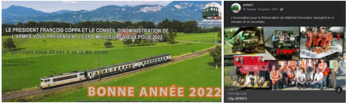
APMFS (73) : Vidéo APMFS 2022 4 minutes 30s = https://youtu.be/c02FAKp2oV4