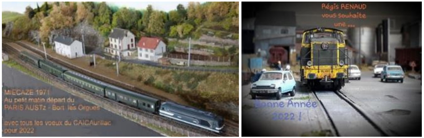
CAIC-Aurillac15 - CFFC (FFMF) Régis RENAUD